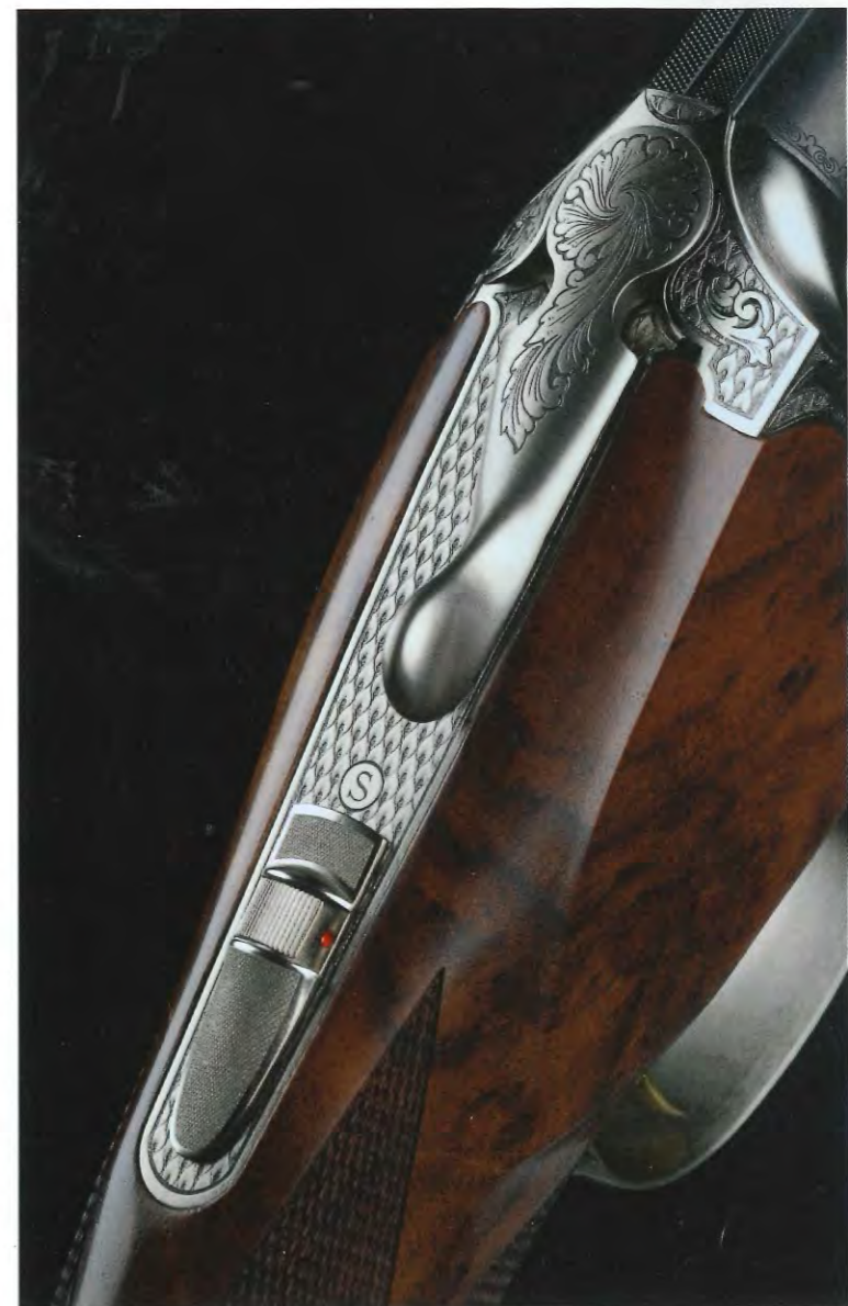
La quasi-totalité de la bascule est gravée, c'est le plus de cette arme originale et élégante.

NOUVEAU : RETROUVEZ LA VIDÉO DE CET ESSAI