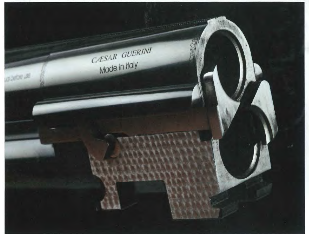
Gros plan sur la frette bouchonnée et les deux crochets de verrouillage bas et massifs.

La coquille supérieure est juste polie et en forme de virgule et celle inférieure est gravée et semble allonger l'aileron de canon. Quant à la gravure, elle est inédite dans la famille sporting. Elle mélange des feuilles d'acanthe et des motifs géométriques en losange, d'un style moderne très réussi, qui évoquera à certains des écailles de poisson, à d'autres un treillis d'osier. Les feuilles d'acanthe ornent le haut, la clé et les oreilles de la bascule, et semblent tomber en corne d'abondance le long du filet supérieur du