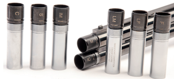
Cæsar Guerini Invictus I leveres med MAXIS-chokes, som kan skiftes uden brug af værktøj.

Baskylen er en "rounded body" med afrundede sider og bund, som ser godt ud, men også giver våbnet et elegant udseende uden skarpe kanter. Baskyle og aftrækkerbøjle er smukt lasergraveret med akantus schroll. Låsen er en bokslås, som er konstrueret efter velafprøvede principper, og som fremstår enkel og solid. Aftrækket er singleleaftræk og står skarpt uden at slæbe med en aftræksvægt på 2,3 kg. Sikringen sidder på kolbehalsen og er let at betjene. Om-skifteren mellem første og andet skud påvirkes af rekylen. Våbnet er som standard uden løbsvælger, men dette kan ligesom dobbeltaftræk tilkøbes via costum shop.