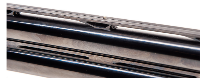
Lyman-korn på Caesar Guerini Invictus I.