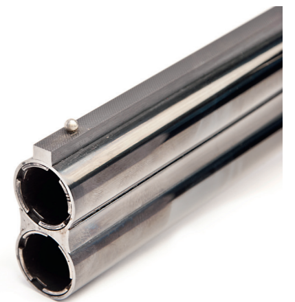
Fuldloddede skinner og perlekorn i metal er med til at give Caesar Guerini Ellipse EVO et klassisk look.

ud i håndfladen. Bagkappen er af sort gummi. Skæftet er i valnød og overfladebehandlet med en hærdende olie. Standardskæftelængde er 37,7 cm med en krumning/drop på 35 mm ved næsen og 55 mm ved hælen. Cast off er ikke oplyst, men opmålt til ca. 3 mm. Fabrikken tilbyder en række individuelle valg af skæftemål mv. mod merbetaling.