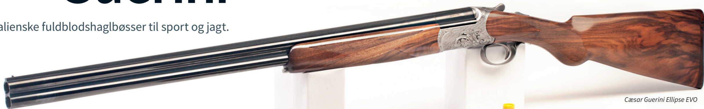
Caesar Guerini Ellipse EVO

– italienske fuldblodshaglbøsser til sport og jagt.