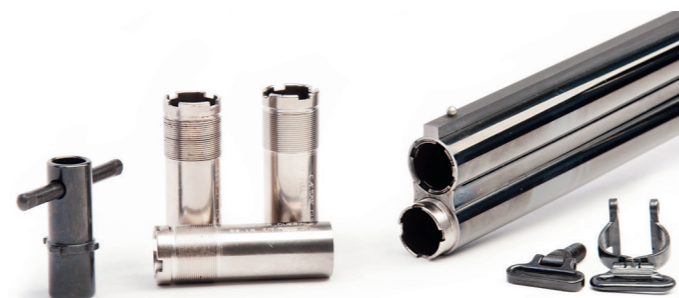
Cæsar Guerini Ellipse EVO leveres med fem stk. udskiftelige chokes samt rembøjler til eventuel eftermontering.