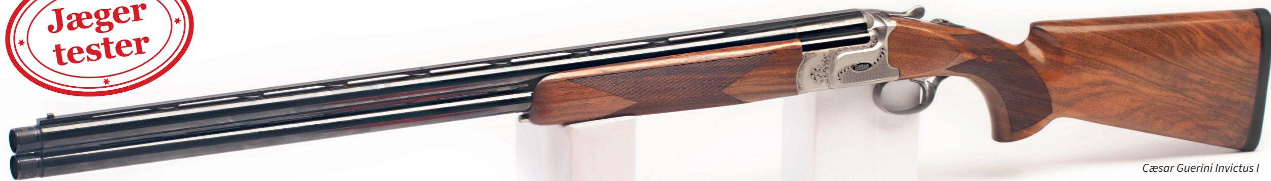
Caesar Guerini Invictus I