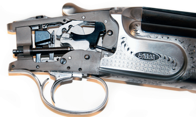
Låsen er bygget over velkendte principper og bør ikke give anledning til problemer. På billedet ses Invictus I, men principperne er de samme for både Cæsar Guerini Invictus I og Ellipse EVO.

Slitage på låsen opstår både under affyring af skud, og når vi åbner og lukker våbnet. Ved betjening af våbnet er det vigtigt, at vi ikke smækker låsen unødigt hårdt sammen, men lukker låsen med et lille klik, der indikerer, at låseriglerne er faldet på plads. For at sikre, at låseriglerne falder på plads, bør langt de fleste haglvåben lukkes, uden at man holder på toplukkenøglen. Forkert eller mangelfuld smøring af låsen kan også forøge slitagen på låsen. Metaldele, som arbejder sammen i låsen, slides mindst, hvis de kører på en oliefilm eller i fedt. Dette gælder dog kun, hvis olien eller fedtet er rent og ikke fyldt af skidt eller sand. Derfor bør man rengøre lukkeknaster og rigler med jævne mellemrum og smøre med ny olie eller fedt. Skal våbnet bruges i et miljø med meget støv, kan man med fordel anvende et smøremiddel, som tørrer op og dermed ikke så let tiltrækker støv.