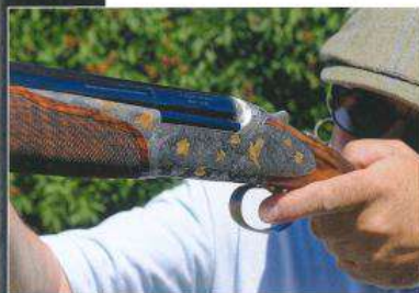
La prise en main est très bonne grâce à une poignée parfaitement dessinée.

Au fond de la bascule apparaît le très large verrou monobloc de 28 mm. A la fermeture de l'arme, il vient prendre appui sous le canon à l'intérieur de la mortaise de son crochet arrière. Ce gage absolu de solidité est encore renforcé par des flancs de bascule de 6 mm d'épaisseur. Le crochet arrière comme le crochet avant font partie intégrante de la frette monobloc des tubes. Ils pivotent sur les deux tourillons inter-