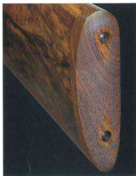
La plaque de couche en noyer pourra être remplacée par une plaque absorbante et un gainage cuir par exemple.