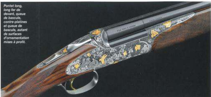
Pontet long, long fer de devant, queue de bascule, contre-platines et queue de bascule, autant de surfaces d'ornementation mises à profit.