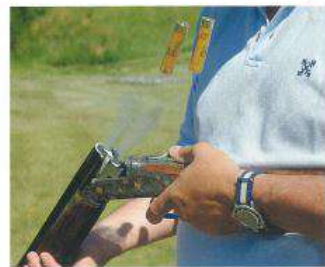
L'éjection, à échappement, est simultanée – la preuve en image –, et surtout régulière et franche.